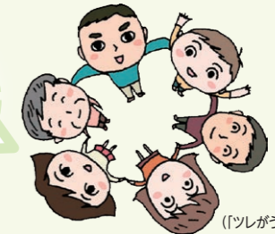
イラスト: 細川 聡々 [ツレがうつこになりまして。]著者

悩んだ時、どこに相談したらよいか迷うことはありませんか? 困った時は、それぞれの窓口で相談しましょう!