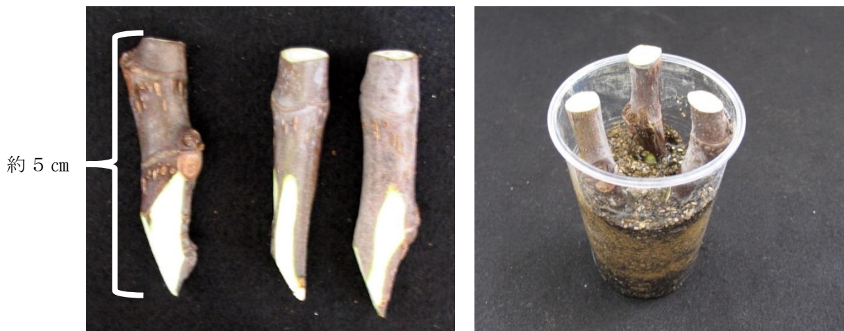
写真 2. 左: 挿入する枝, 右: 検定土に挿入した様子