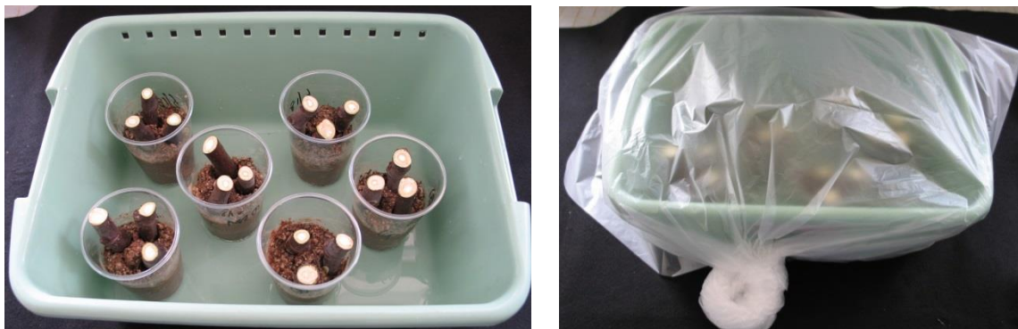
写真 3. 培養時の様子（左：ビニール袋の中，右：ビニール袋で包んだ外観）

おけに 1 cm 程度水を張り，ビニールカップを並べ，ビニールで覆い軽く縛る（写真 3）。株枯病菌の生育適温 25℃を恒温培養器などで確保して 10 日程度静置する。 ※ 調査期間中は，ビニールカップに水を追加補充する必要は無い。