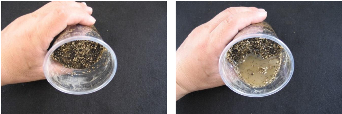
写真 1. 土壌水分の状態 (左: 適性, 右: 過湿)

※ 検定土を適度な水分に調整することが重要。乾燥させると感染しにくくなり, 表面に水が溜まる程までであると枝が腐敗する。