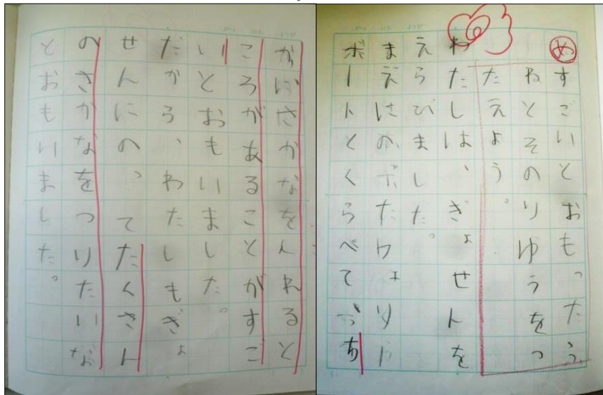
写真4 写真3のワークシートで書いた文章の内容に対する思いを文章化したもの