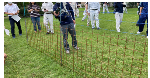
(写真)ワイヤーメッシュ電気複合柵