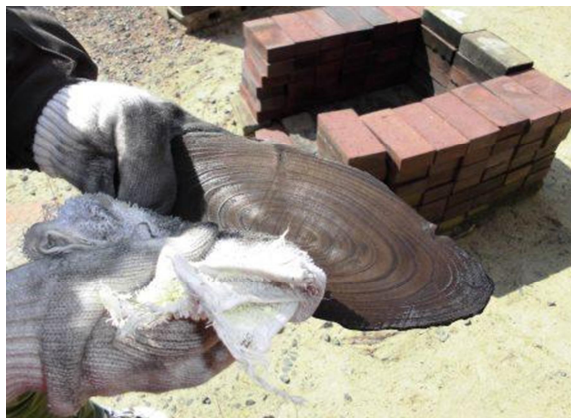
② 木目にそって、布で木目の光沢が出るまでみがく。 ※すすが残っていると絵の具がのりにくいので、しっかりとみがく。