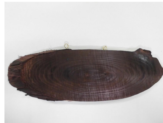
③ ヒートンをつける。