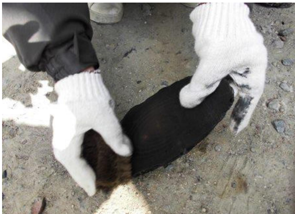
① 木目にそって、たわしですすを落とす。