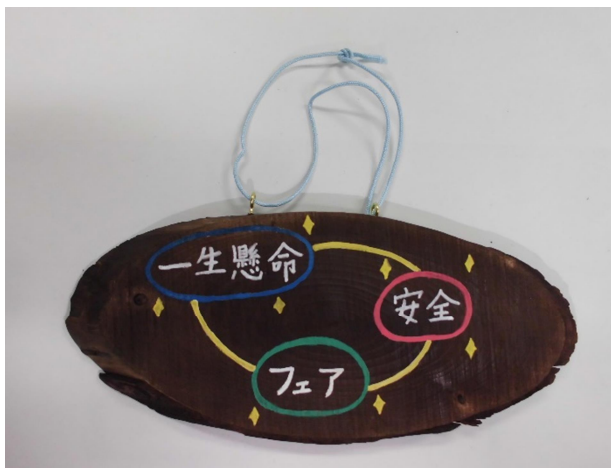
⑤ 組みひもを結び完成。