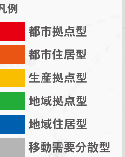
背景：国土地理院地図