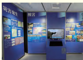
広島市豪雨災害伝承館