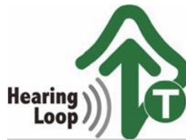
【ヒアリングループマーク】 所管：一般社団法人全日本難聴者・中途失聴者団体連合会