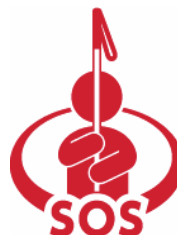
【「白杖 SOS シグナル」普及啓発シンボルマーク】 所管：岐阜市