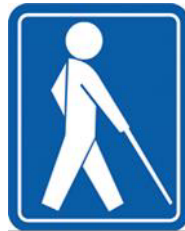
【盲人のための国際シンボルマーク】 所管：社会福祉法人日本盲人福祉委員会