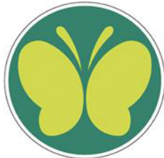
【聴覚障害者標識(聴覚障害者マーク)】 所管：警察庁