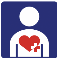
【ハート・プラスマーク】 所管：特定非営利活動法人ハート・プラスの会