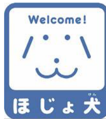
【ほじょ犬マーク】 所管：厚生労働省