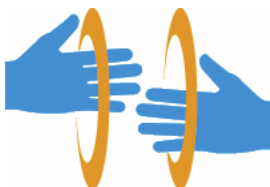
【手話マーク】 所管：一般財団法人全日本ろうあ連盟