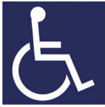
【障害者のための国際シンボルマーク】 所管：公益財団法人日本障害者リハビリテーション協会