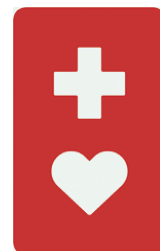
【ヘルプマーク】 所管：東京都