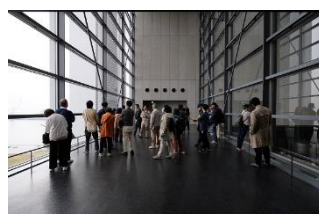
広島市環境局中工場