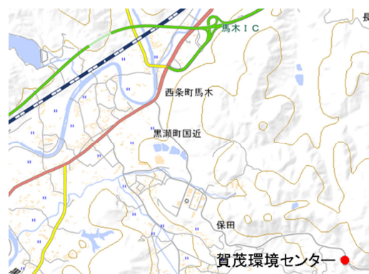
地理院地図（電子国土Web）を加工して作成