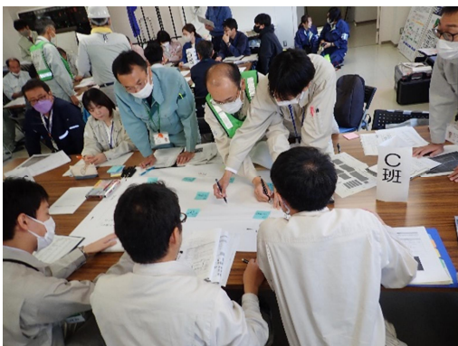
仮置場レイアウトの検討