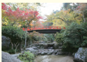
紅葉谷川庭園砂防施設