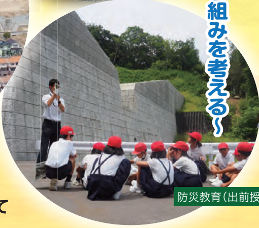
防災教育(出前授業)