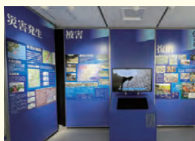
広島市豪雨災害伝承館