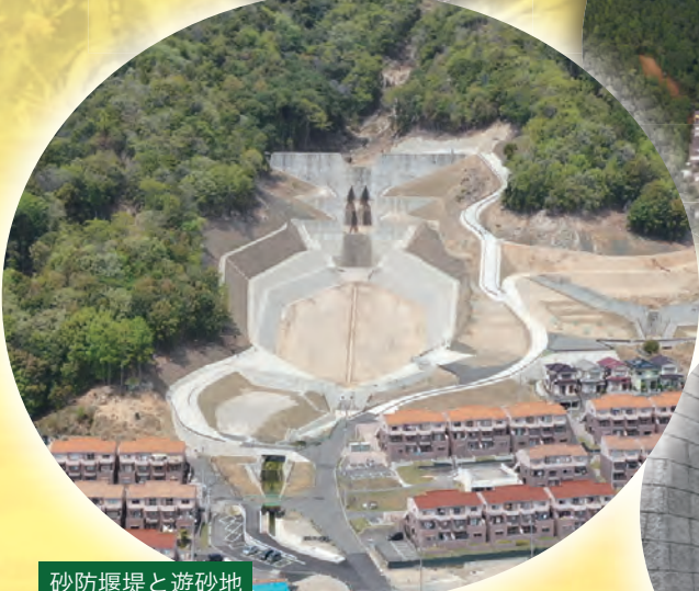
砂防堰堤と遊砂地