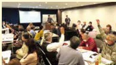
防災士を対象としたマイ・タイムライン普及支援に向けた講師育成研修

▶日本防災士機構や日本損害保険協会等の団体もマイ・タイムラインを積極的に支援しています!!