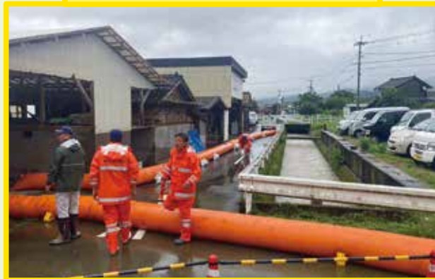
水防工法(大型水のう)