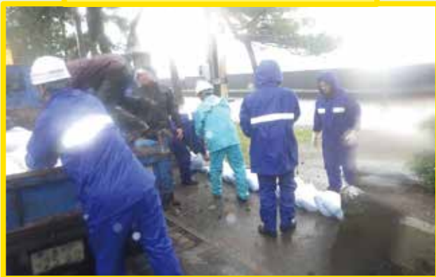
水防工法(土のう積み)