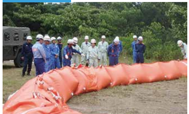
水防資機材の保管、提供