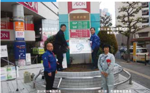
商業施設による水防に関する啓発の協力