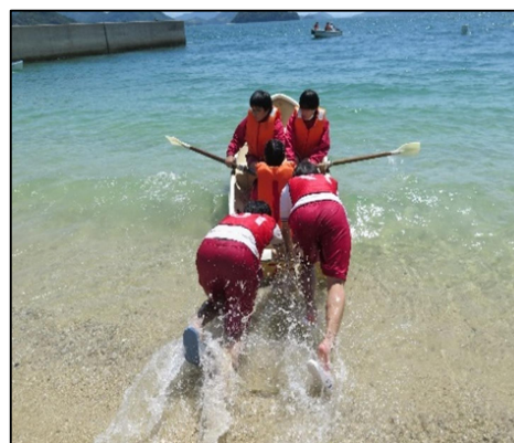
昨年度の活動の様子