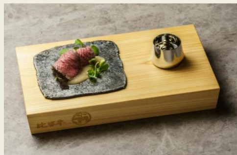
たたら製鉄と特注台座による比婆牛料理