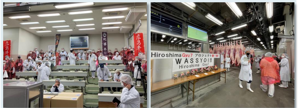
セリ場は、飲食店のシェフなど多くの見学者とマスコミで大盛況でした

世界各国に広島和牛のファンを増やし、広島和牛を選んでもらえる契機として、官民一体となって広島サミットを盛り上げる取り組みのひとつとして、今後の活動が期待されます。