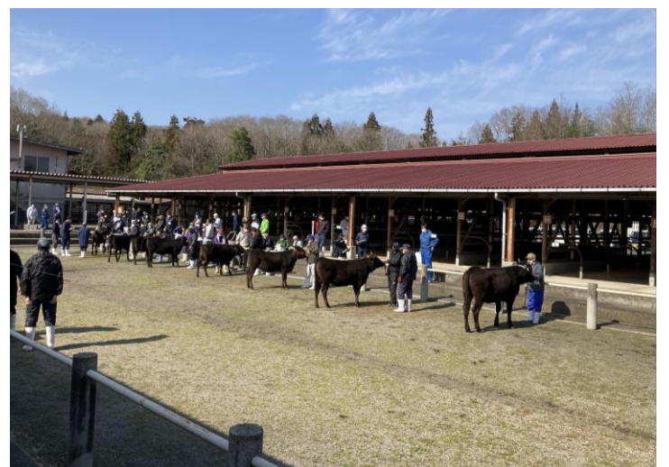
三次家畜市場 現畜調査の風景です

生産者の皆様におかれましては、ぜひ花勝百合の交配や保留の取り組みを行っていただくようお願いします。