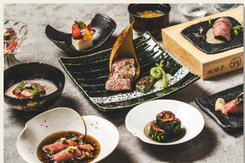
フルコース料理の写真