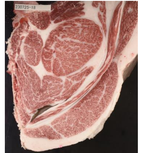
去勢 28.4か月 照茂山×安福久×隆之国 A-5 枝肉重量 464.2kg BMS No. 10 ロース芯 70cm 2