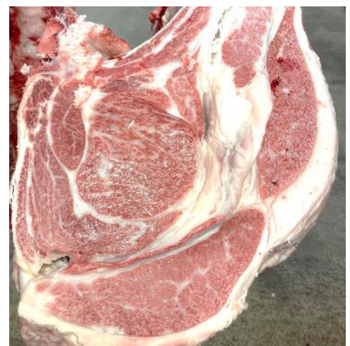
去勢 29.6か月 野村立×安福久×勝忠平 A-5 枝肉重量 606kg BMS No. 12 ロース芯 105cm 2