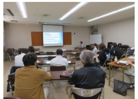
各会場多くの方から、質問や相談が寄せられました。