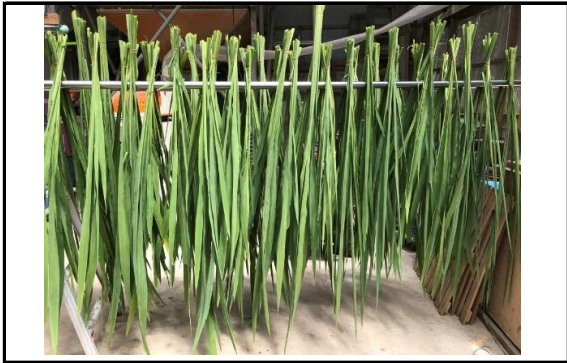
原材料の真菰を干している様子