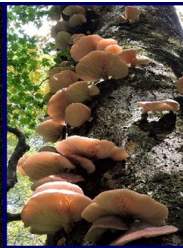
発光するツキヨタケ

きのこには、食べると中毒を起こす毒きのこや、食毒不明のきのこがたくさんあり、食中毒が毎年各地で発生することから、厚生労働省や林野庁は注意喚起を行っています。