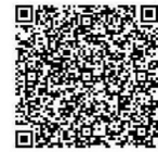
電子申請システム (文化財講座)

当館HP ( https://www.pref.hiroshima.lg.jp/site/rekimin/ ) の各種行事のページから進んでください。