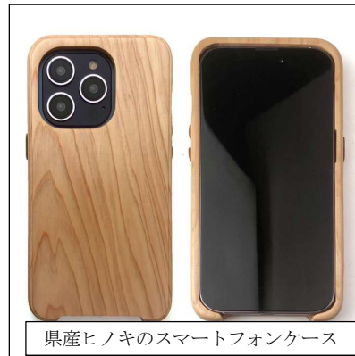
県産ヒノキのスマートフォンケース