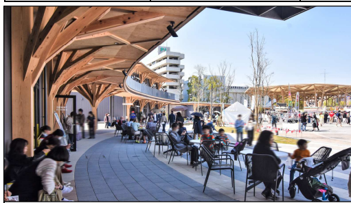
県産スギ・ヒノキを利用したひろしまゲートパーク（ウッドデザイン賞ライフスタイルデザイン部門）