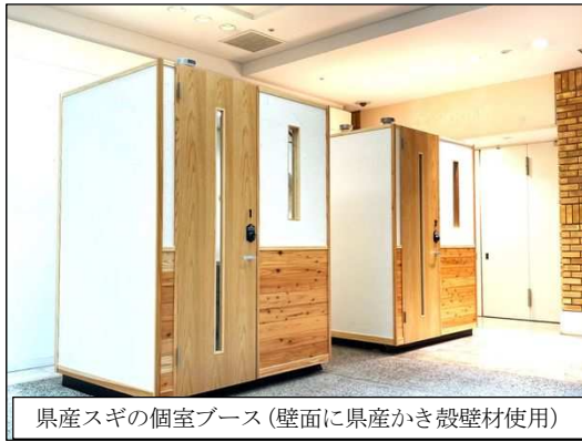
県産スギの個室ブース（壁面に県産かき殻壁材使用）