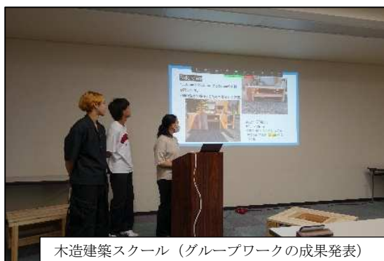
木造建築スクール（グループワークの成果発表）