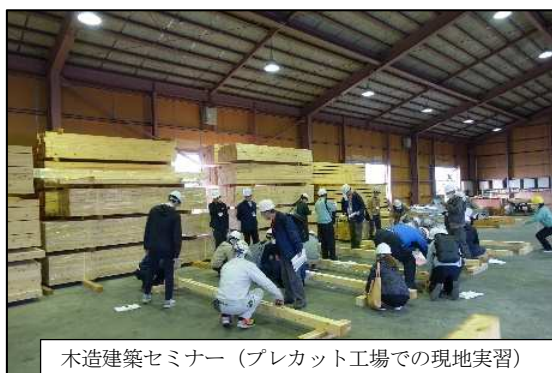
木造建築セミナー（プレカット工場での現地実習）