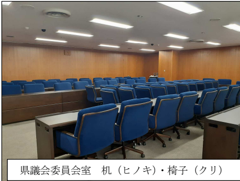
県議会委員会室 机 (ヒノキ)・椅子 (クリ)