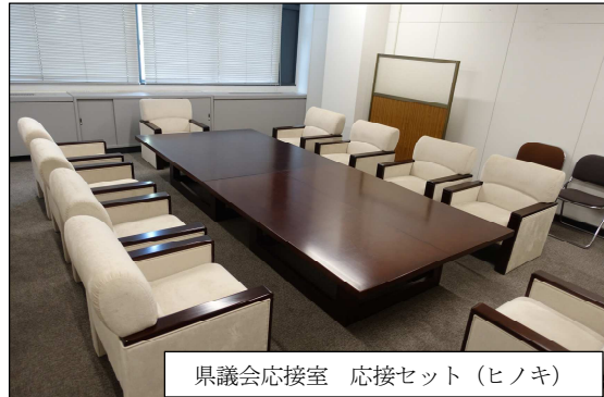
県議会応接室 応接セット (ヒノキ)