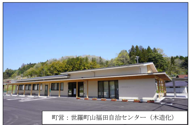
町営：世羅町山福田自治センター（木造化）