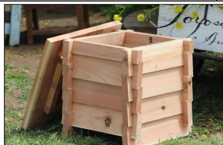
外箱に県産スギを利用したコンポスト（ウッドデザイン賞ライフスタイルデザイン部門）