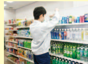
広島障害者職業能力開発校での訓練