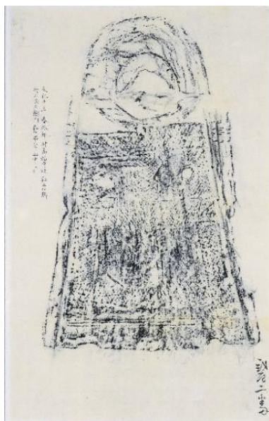
神村出土銅鐸拓本 （重要文化財菅茶山関係資料）当館蔵