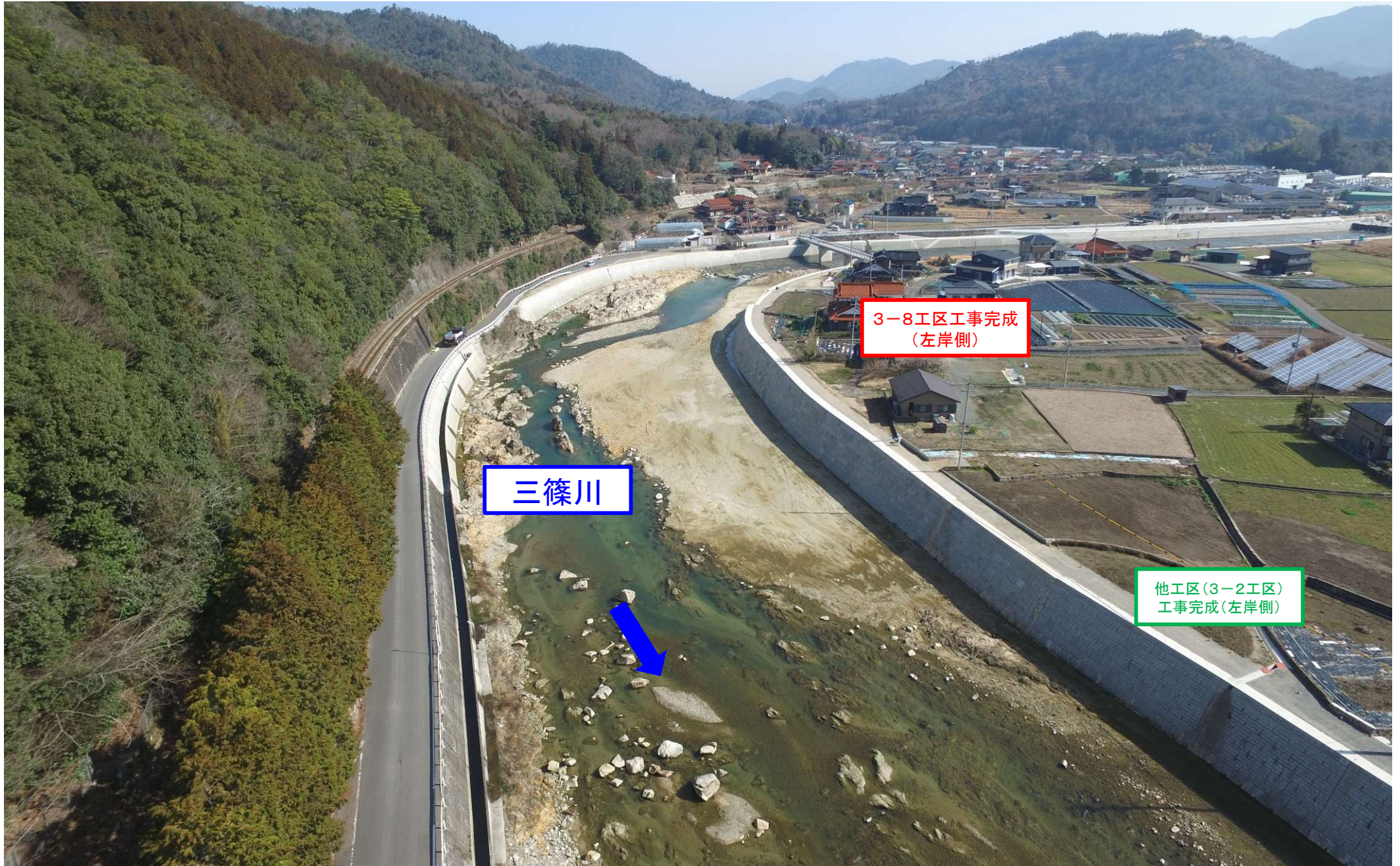
写真②（施工箇所付近全景）