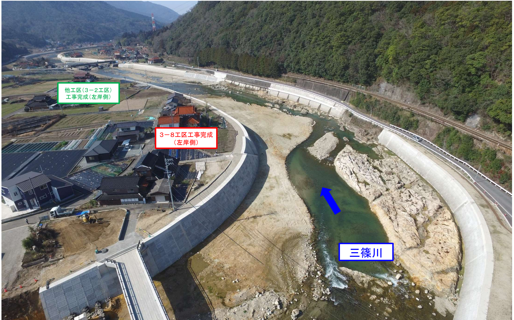
写真③（施工箇所付近全景）