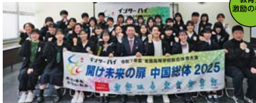
教育長 激励の様子

令和7年度インターハイを「高校生による高校生のための安全・安心で一生心に残る大会」とするため、高校生自身が県実行委員会の一員となり、おもてなしや機運醸成における権限と責任をもってプロジェクトを行います。