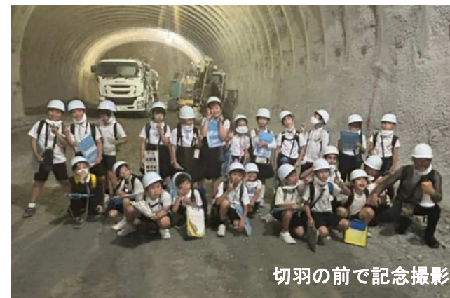
切羽の前で記念撮影