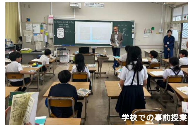
学校での事前授業