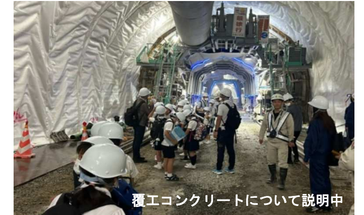
覆工コンクリートについて説明中