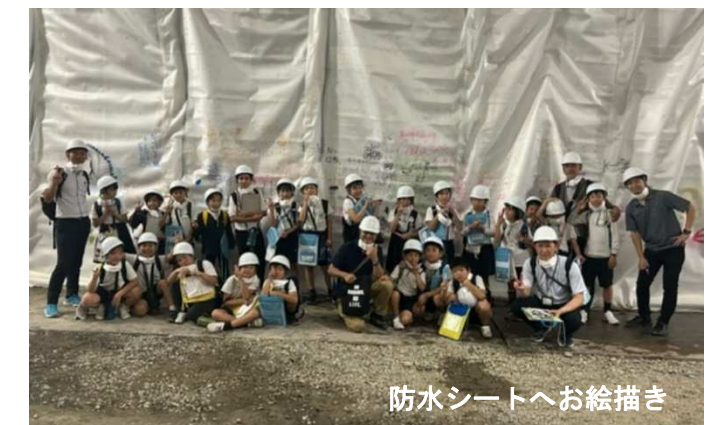
防水シートへお絵描き

※「むろのき通信」は、広島県ホームページ【 https://www.pref.hiroshima.lg.jp/soshiki/217/muronoki.html 】, 福山市ホームページ【 https://www.city.fukuyama.hiroshima.jp/soshiki/kowankasen/ 】にも掲載しています。