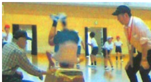
支援活動（体育科）の様子

発足以来、国語科（書写）、図画工作科、家庭科、体育科、生活科、読み聞かせ、クラブ活動、校外学習引率など多岐にわたって様々な学習支援を行っている。その中でも体育科の支援については、市内の他の本部に先駆けて取り組んだ実績があり、安全確保などを目的に倒立や跳び箱などの授業で補助やアドバイスをを行い、児童のチャレンジする気持ちの向上や事故防止の面において、効果的な支援が実施できている。