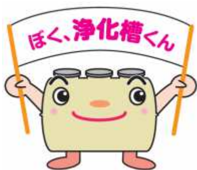
広島県浄化槽キャラクター