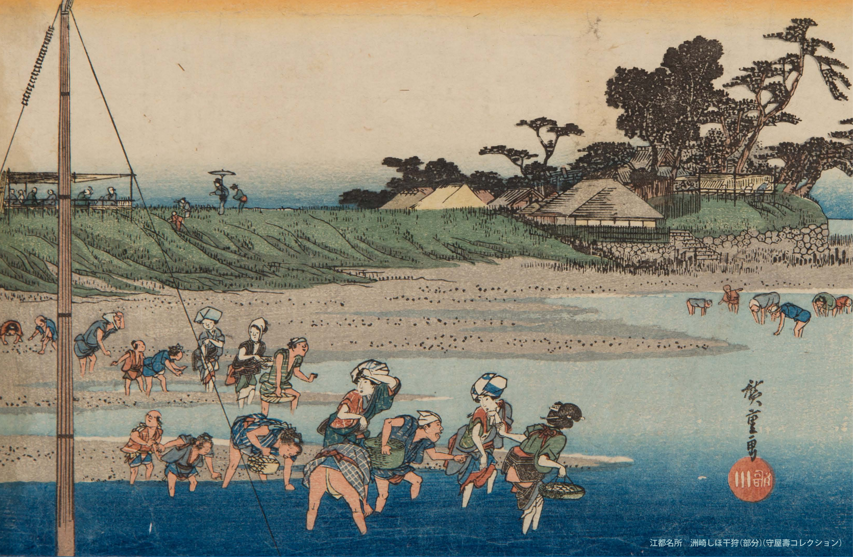
江都名所 洲崎しほ干狩(部分)