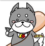
生徒考案キャラクター “ひろしばけん”