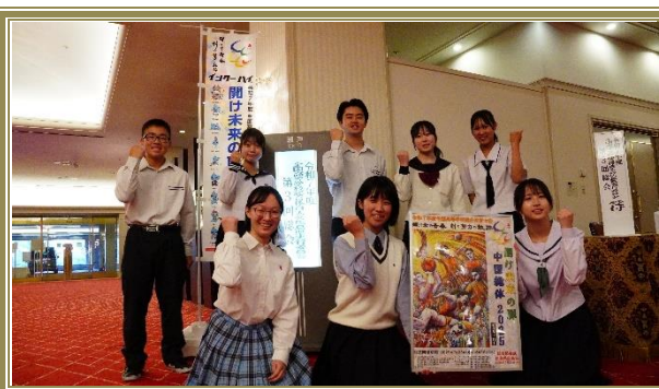
広島県高校生活動推進委員会 (執行部)