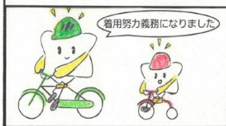
自転車のヘルメット着用