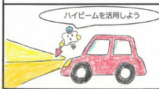
早めのライト点灯