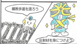
歩行者の交通事故防止