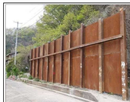
仮設防護柵のイメージ