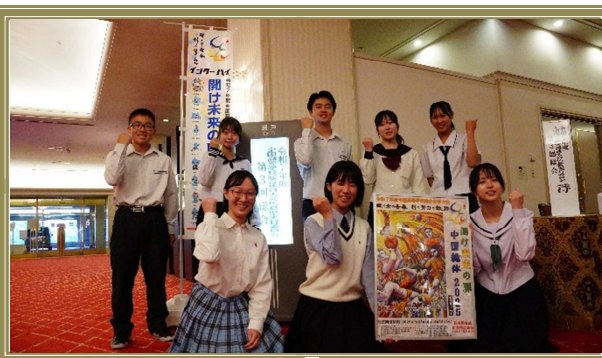
広島県高校生活動推進委員会 (執行部)