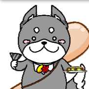
生徒考案キャラクター “ひろしばけん”