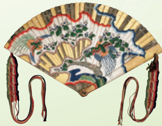
檜扇 宮中で用いられた檜製の扇。金や胡粉・紅・緑青などでおめでたい柄が描かれます。