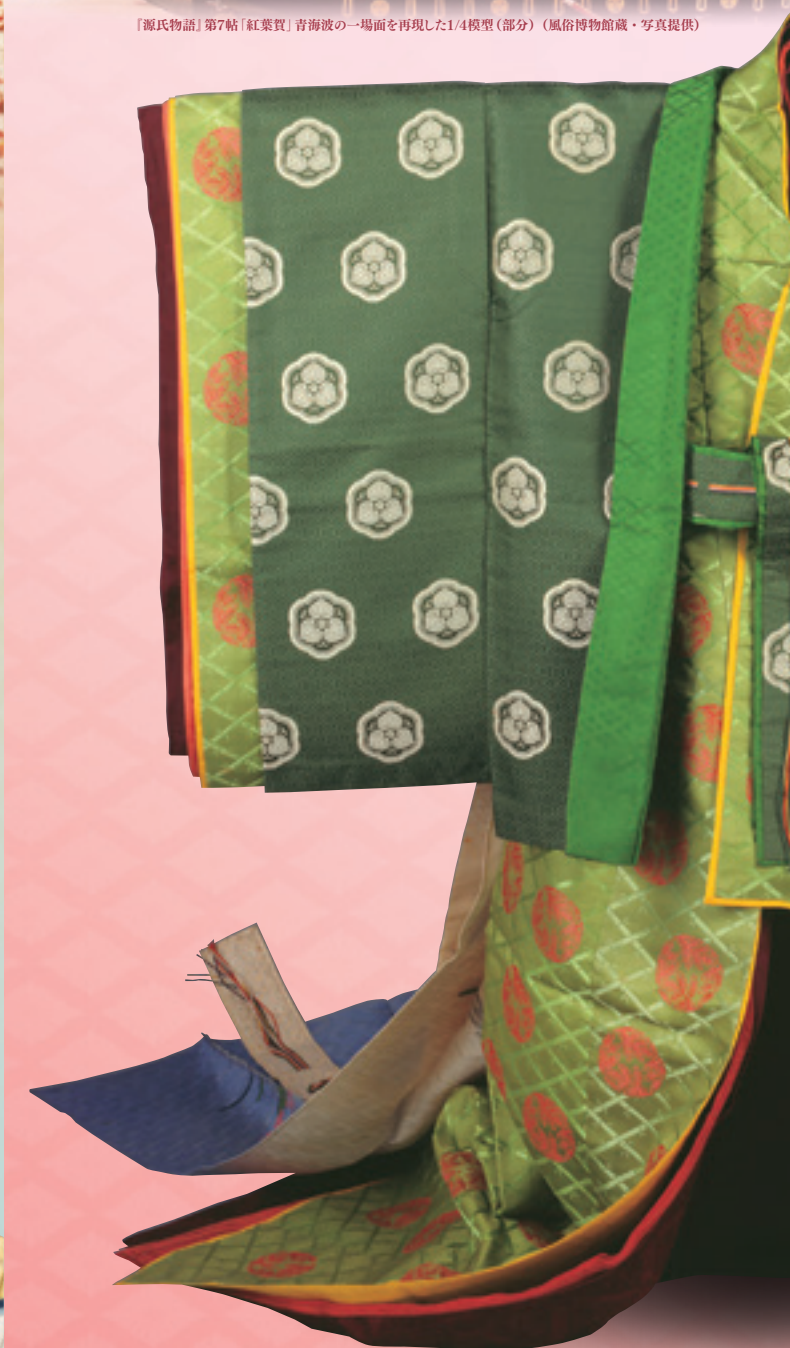
五衣・唐衣・裳 (秩父宮紀勢津子殿下所用 京都国立博物館蔵・写真提供) ※展示替えあり：展示期間(～10月27日)

入館料 一般1,100円(900円)、大学生・高校生700円(500円)、 中学生・小学生350円(280円) ※( )は前売り及び団体料金(20名以上)。 ※学生の方は、学生証を提示してください。 ※身体障害者手帳、戦傷病者手帳、療育手帳及び精神障害者保健福祉手帳の所持者と 介助者(1名まで)の当日料金は半額です。手帳を提示してください。 ◆前売り・当日券とも、ローソンチケット【Lコード:64056】及び広島県立歴史博物館の受付窓口で販売しています。