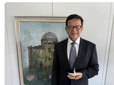
写真④ニキル・セス国連事務次長補 兼ユニタール総代表