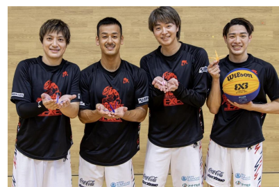
写真①スリストム広島の皆さん