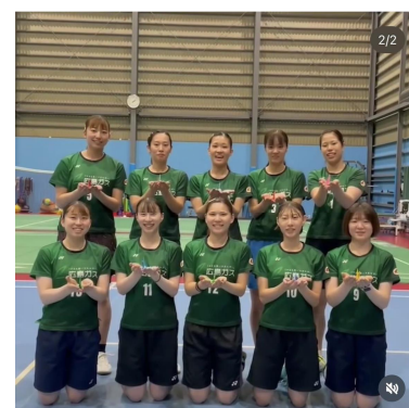
写真②広島ガスバドミントン部の皆さん