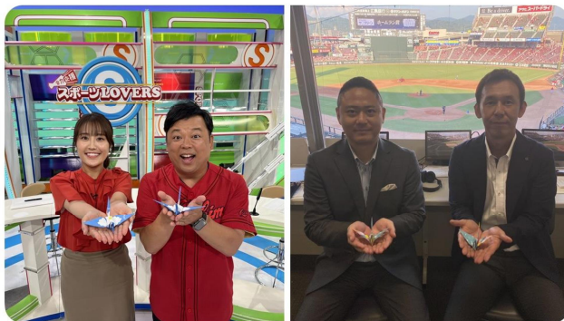
T S S 全力応援スポーツ LOVERS 出演者の皆様