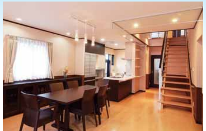
【LDK】 家族の行動を把握できるリビング階段型を採用しました