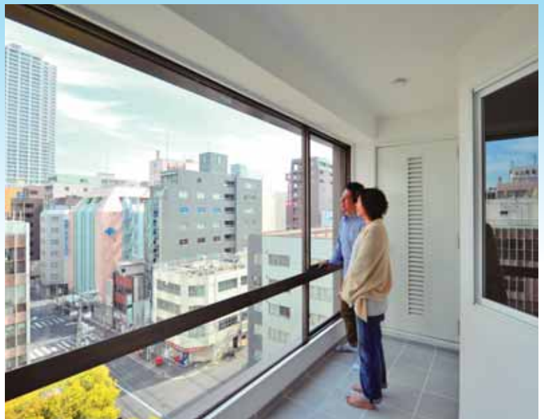
洗濯物が干せるようにと設けたサンルーム、窓の向こうには市内が一望できます、テーブルとイスをもってくればゆったりとカフェタイムも楽しめます