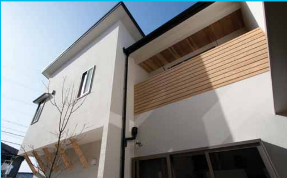
東側外観:日射受熱の多い東西は小さな開口部で

南からアクセスする縦長の不自由な敷地の建物配置を、風や光に配慮して入念に計画し、全体として自然に対して優しくパッシブに対応し、細かな建築的な工夫でエコを実現した作品である。