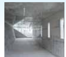
駐車場内部も利用していきます