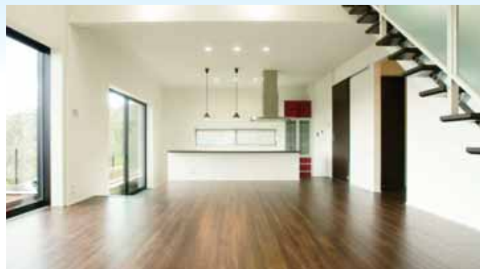
大屋根の勾配天井と開放的なLDK