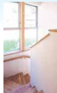
階段に設けられた通風採光窓