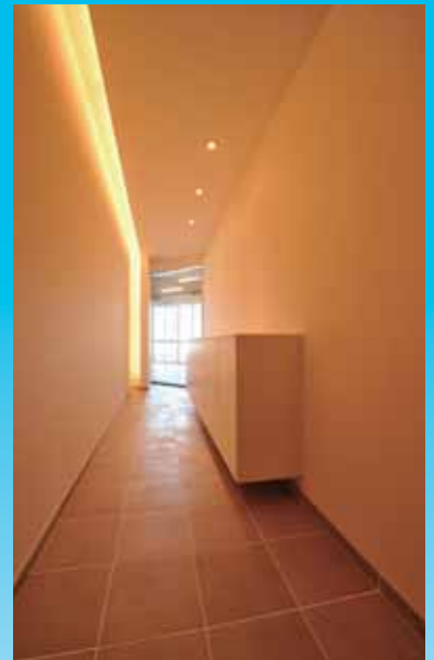
ぬくもりを感じる照明に照らされたエントランス