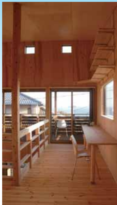
2階セカンドリビングは趣味と憩いの間