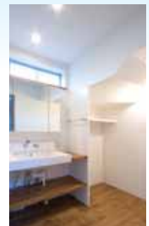
「洗面所」階段下は洗濯スペース