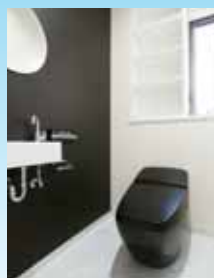
ゆったりとしたトイレ空間