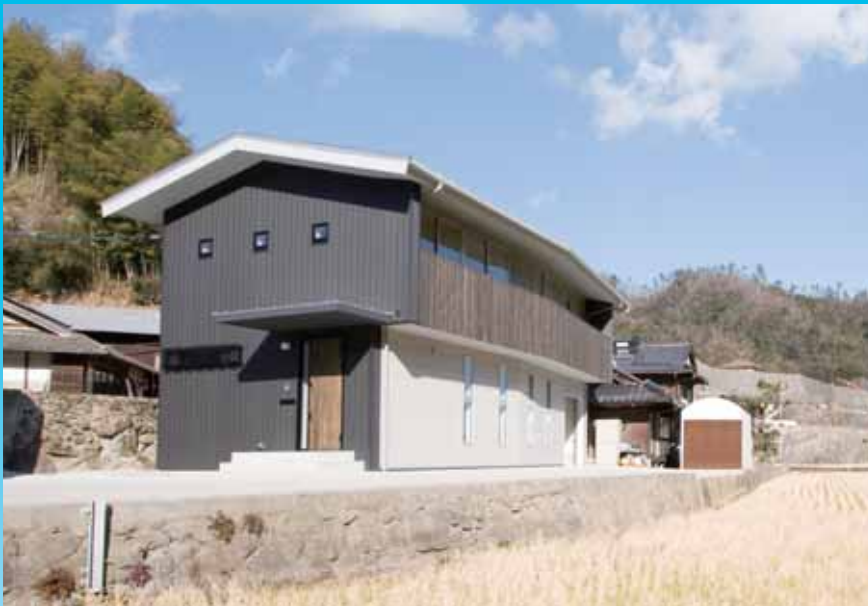
「棚田が続く田園風景,母屋(写真右奥)の隣に建つ」

母屋との「絆」を感じさせる隣居型の住宅。豊かな自然環境を考慮した外観デザイン,子供部屋からは母屋が臨め,将来の関係性も意識した設計。バリアフリー・省エネ性にも配慮し,三世代が助け合って暮らしつつ,住み継がれる住宅が実現している。