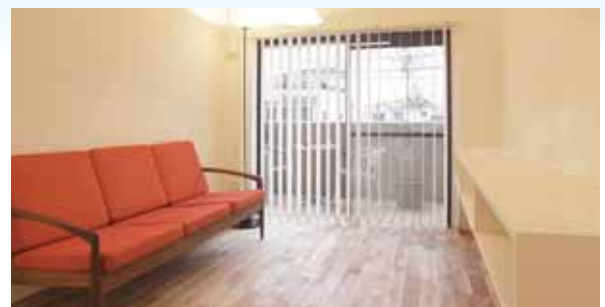
内外流動的に感じさせる床材