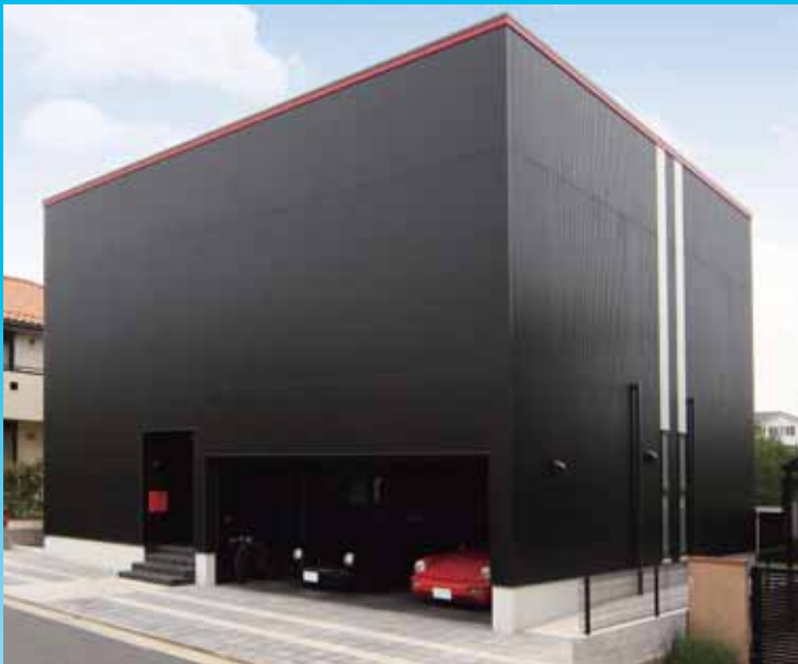
無駄のないシンプルな外観は施主さまの要望からスタートした

入居後には快適に過ごせて大変満足しておりますと言葉をいただき、設計者としても喜びの一言となった。