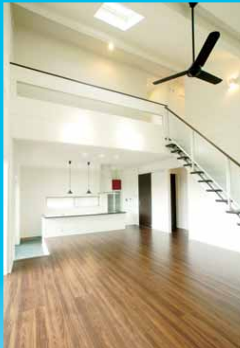
室内は開放的で心地よい空間を実現