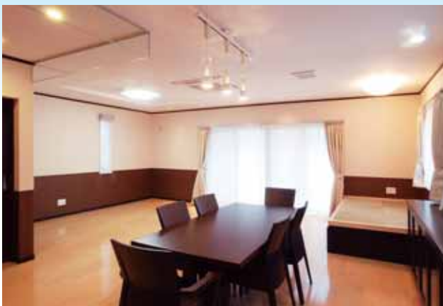
【LDK】 たたみコーナーを一段あげ,リハビリにも利用できるようにしました