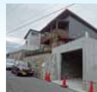
2期工事の駐車場工事中