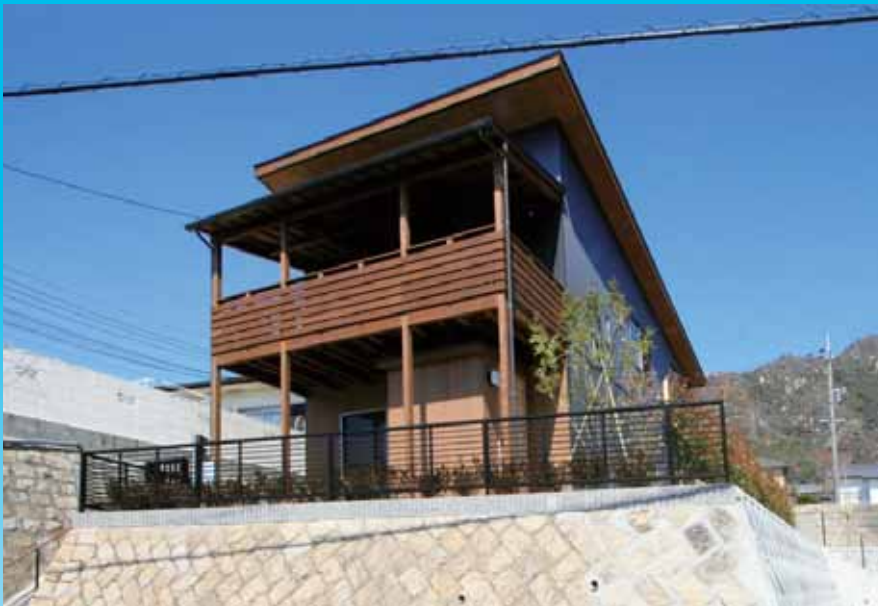
駐車場の無い造成区域の立地にいかに計画をするかが課題であった

コストダウンに努め、妥協しないこだわりを追求した住まいづくりの中に、木の香りでこころ和ませるほど贅沢に木を使い、自然と調和しながら、住宅として省エネ、バリアフリー、耐震、デザイン性の要望にも応えられた作品である。