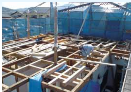
通し柱2本を残し,既存2Fを撤去 竹組み替えをして,新しい間取りに