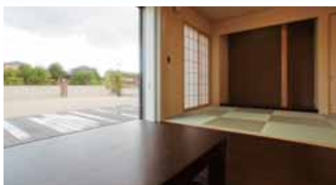
LDKにさらなる広がりをもたらせるウッドデッキ