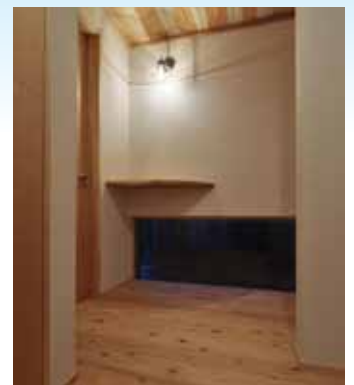
床・天井に杉ムク板を使った玄関ホール