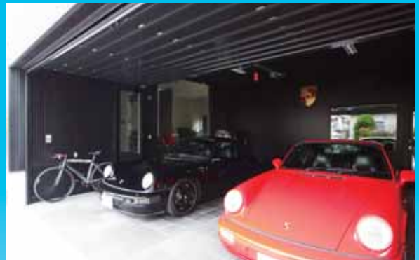
2台並列駐車も余裕のビルトインガレージ。ご主人の趣味部屋も隣接