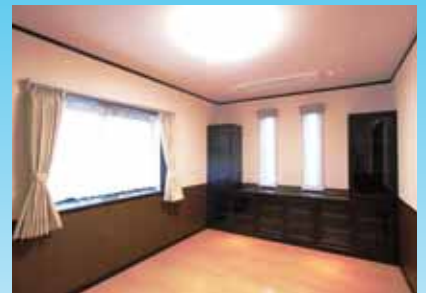
【書斎・応接室】 造付家具・腰壁の色を統一し,落ち着いた雰囲気になりました