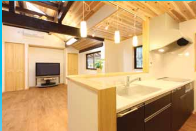
After / LDK全体