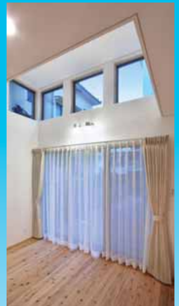
高窓よりのリビング採光