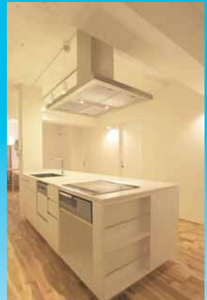
幅3.5mなる人造大理石の天板を使用したアイランドキッチン