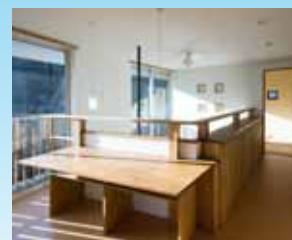
「2階スタディスペース」右奥に主寝室が見える吹き抜けの手摺は本棚を兼ねている