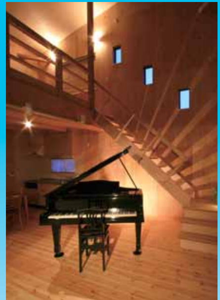
吹抜けリビングも蓄熱式暖房設備で大空間を快適に