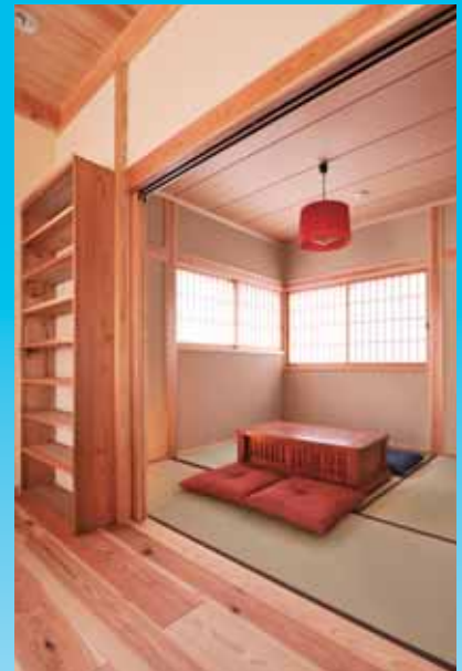
リビングに続く和室の客間、戸を全て引込むと広がり空間