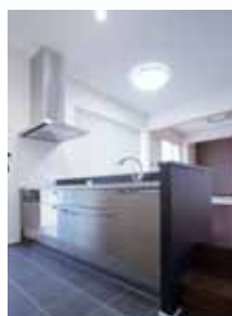
ステップダウンさせたキッチンからは、リビングダイニングとの視線が合いやすい