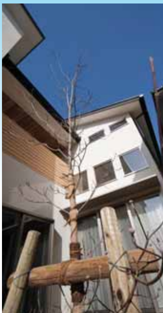
庭中央の落葉樹で夏冬の日射コントロール