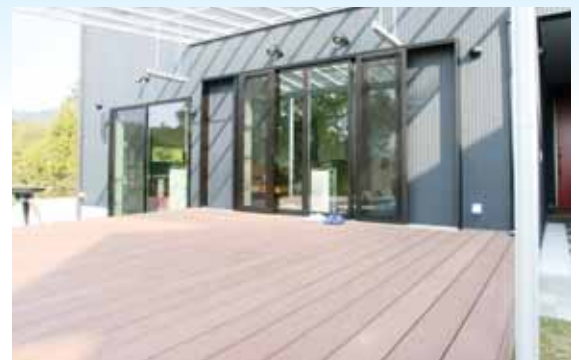
リビングからテラスへフラットにつながる