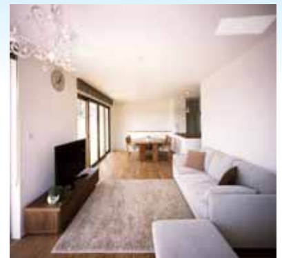
リビングからダイニングを見る