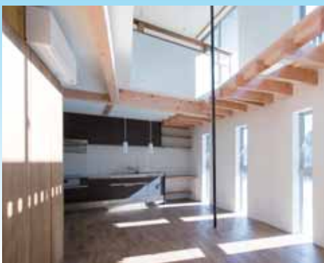
玄関から吹き抜けを見る視察中に光がふりそそぐ