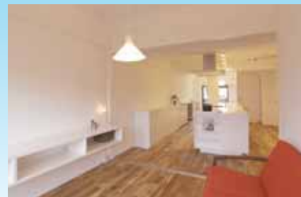
東西に開口を設けることで通風・採光を見込める