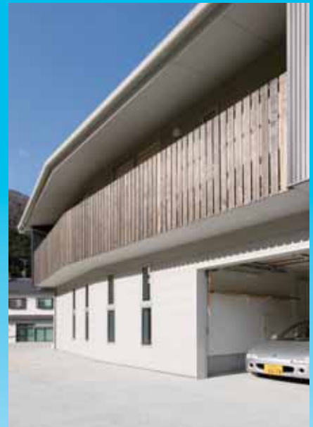
「南側は母屋への通路」外観はセメント系サイディング