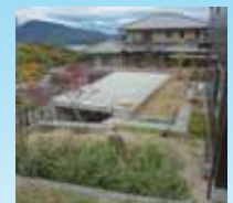
駐車場上部の利用もこれから計画