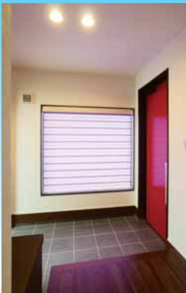
玄関を広く使えるようL型框を採用 玄関ドアカラーがアクセント