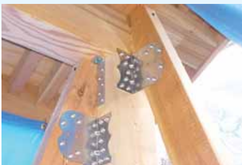
増築部分（スジカイ,金物補強）