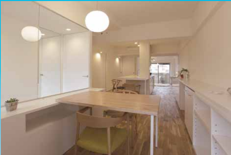
長いワンルームが空間に広がりをもたらす

築25年のマンションをスケルトンにし、フルリノベーションした事例で、制約のある集合住宅において無垢床材の使用や自然採光の取り入れ方など、今後増加するであろう中古マンションリノベーションの方向性を見出す作品である。