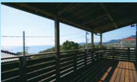
大きな庇におおわれた2階デッキは9帖の広さ