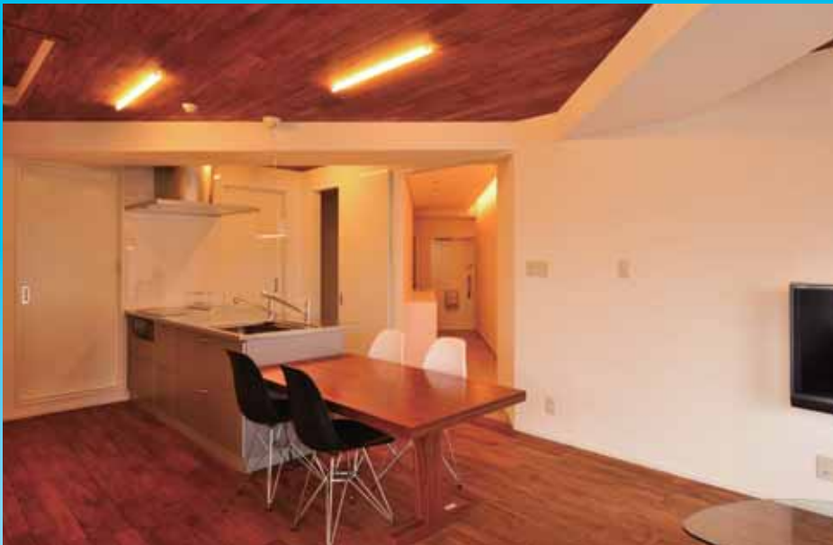
「斜めに配置したLDK」床と天井の両方にナラの無垢材を貼ることで空間にシャープな印象を演出しています

事務所として使われていた築38年のマンションの一室について、既成概念にとられない大胆な計画手法を適用し、アーバンライフを満喫できる新しい生活空間を創り出すスケルトン・リノベーションの興味深い実践例である。