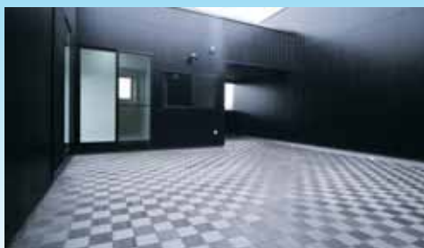
外からの視線を遮断するプライベート性の高いオープンテラス