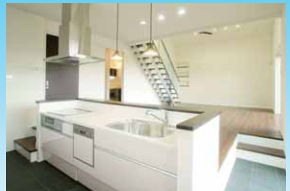
アイレベルをあわせるため、キッチンはステップダウンさせた