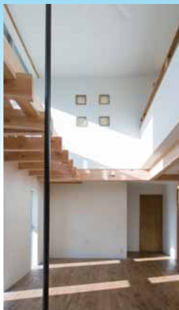
「正面1階は玄関」2階は主寝室