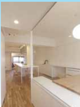
ガラス張りの玄関。 硝子の下はシューズ クロークとなる