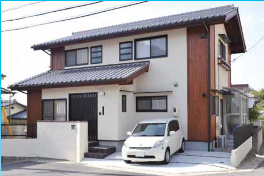
ご主人のご要望でもあるアクセントの桧板貼が特徴

独立キッチンから横を向いて家族の様子が見えるようにしたいというご要望から、どこにいても家族と会話ができる間取りと家事動線に配慮しました。何度もお施主様と打合せし細部までお施主様の使い勝手に合わせて施工しました。間取りも外観もシンプルで飽きのこないデザインです。お施主様からは風通し、日当たりが良く木に囲まれ心地が良い。生活スタイルにマッチしているのも非常に住み心地が良いと言って頂きました。