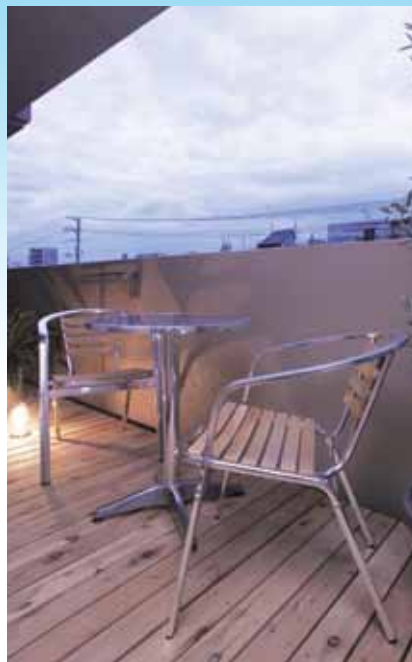
全面デッキ張りにすることで ガーデニングを楽しめる