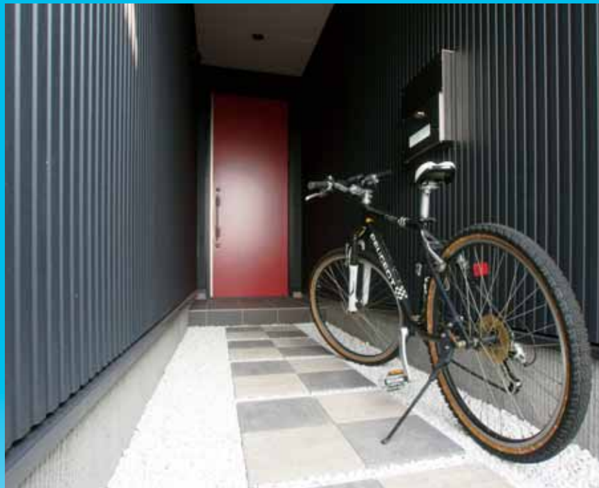
プライベート感あるエントランスは土間感覚で自由に使える

森と貯水湖を望む絶好の周辺環境を活かし、自然を身近に満喫できるデザインを実現するとともに、「座って暮らす」スタイルの提案など、室内空間にも優れた配慮をしている。また、耐震性、省エネ性能についてもトップランナー基準を満足するなど、高い水準を実現している。