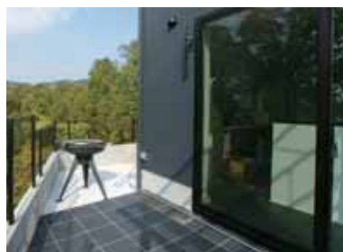
眺望を存分に楽しめるフルオープン サッシから、光と風そして季節の移ろい 感じられる