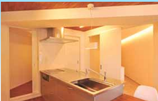
左の扉はパントリーへ、右の扉は浴室や、洗面、トイレといった水回りスペースへと入り口になっています