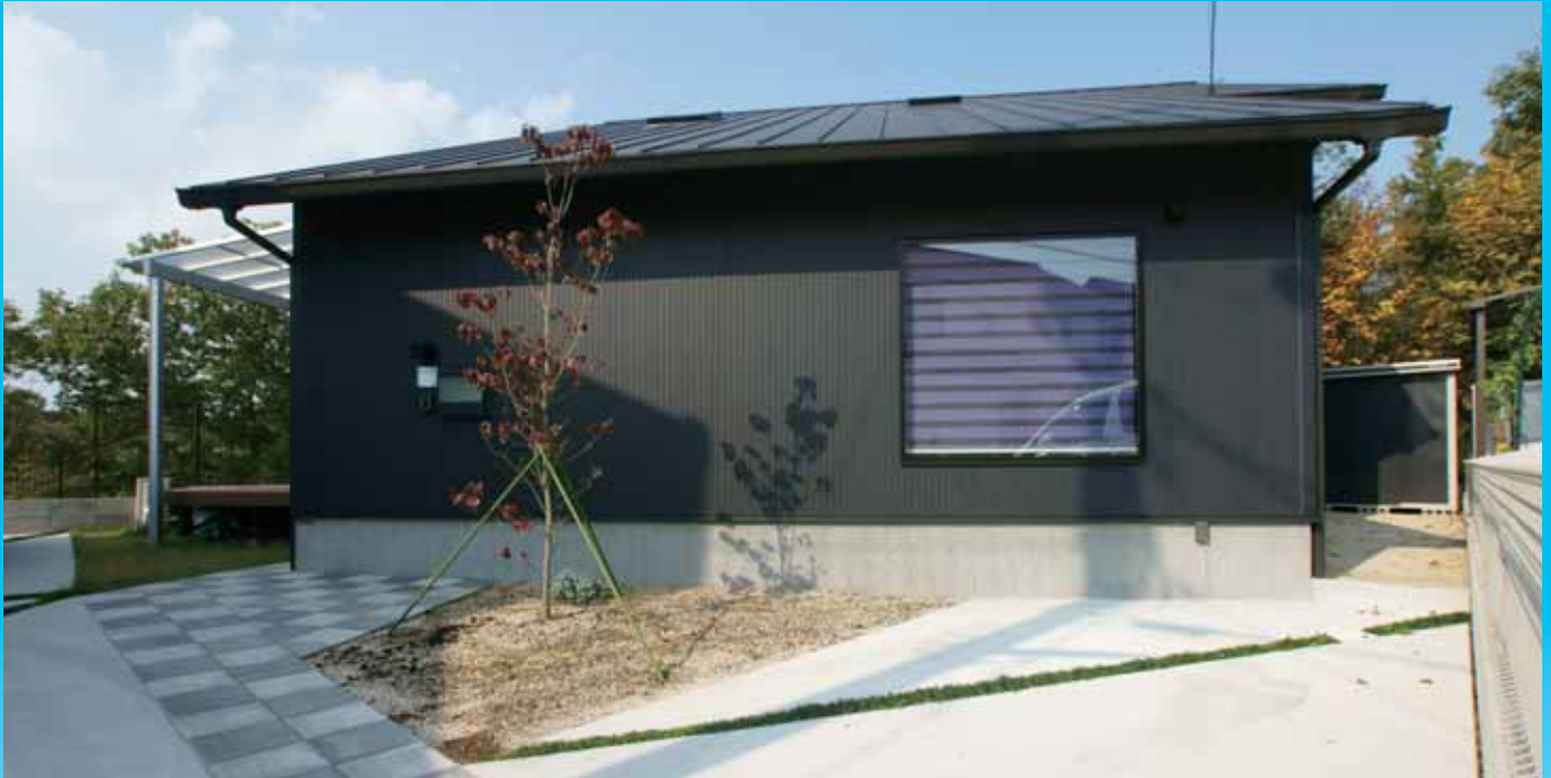
ロケーションを活かし、周囲の環境に溶け込む平屋風の大屋根デザイン