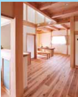
水廻りからLDKをみる