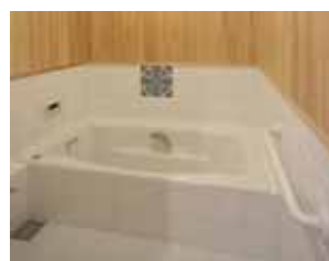
水廻りにも木材を露出させ快適環境創り