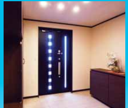
【玄関】 靴履き替えのため,玄関収納横に椅子を設けています。段差なしで室内に入ることができます