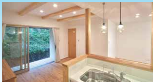
北側裏山(隣地)を借景とした通風大開口