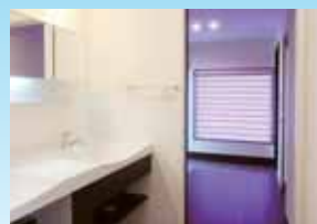
2ボウルのゆったりとした洗面室。上部はトップライトのある吹抜けでより開放的に