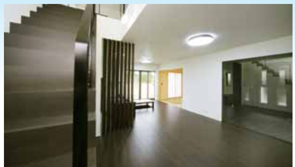
リビングから愛車を眺められる、ガレージと一体感あるLDK空間