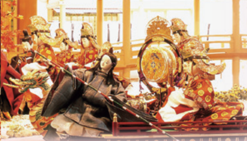
【源氏物語】第7帖「紅葉賀」青海波の一場面を再現した1/4模型(部分)