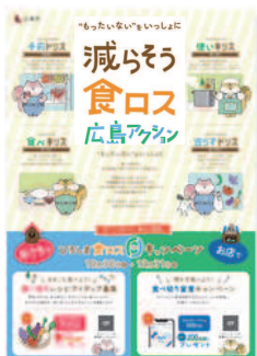
ポスター (A2サイズ予定)

※提供部数は事務局に一任いただきます、ご希望の部数のご要望に沿えない場合がありますのでご了承ください。