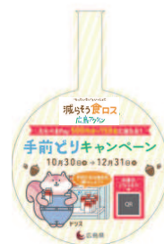
スイングポップ (直径9cm程度) ※手前取りキャンペーンのみ対象