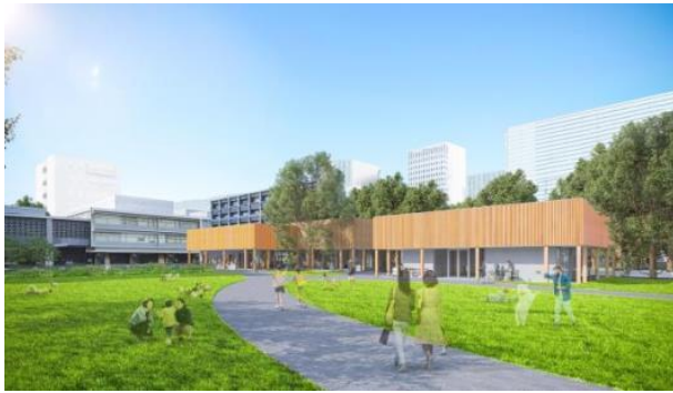
敷地西側の通り（鯉城通り）からの外観イメージ