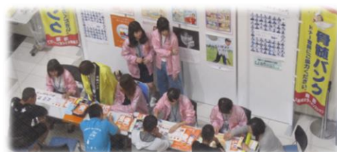
過去の集団登録会の様子