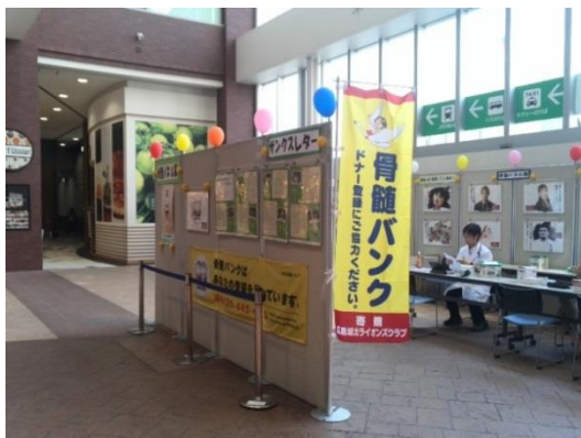
過去のパネル展の様子

（骨髄ドナー登録会に関するお問い合わせ先：公益財団法人ひろしまドナーバンク 電話082-256-3523）