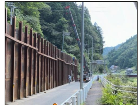
仮設防護柵の設置状況