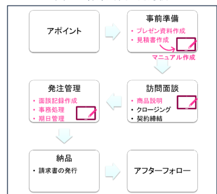
図 3：作業プロセス図と作業マニュアルの作成

各作業が正しく行われているかの判断基準（チェックポイント）を明確にしておきます。問題を早期発見し、誰でもミスなく作業が行えるようにします。