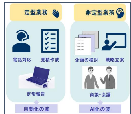
図 1：定型業務・非定型業務

【ポイント】 「定型業務のローコスト化」によって生じた時間や資金といった余剰リソースを、「非定型業務の差別化」に投資することが、企業競争力を高めることにつながります。