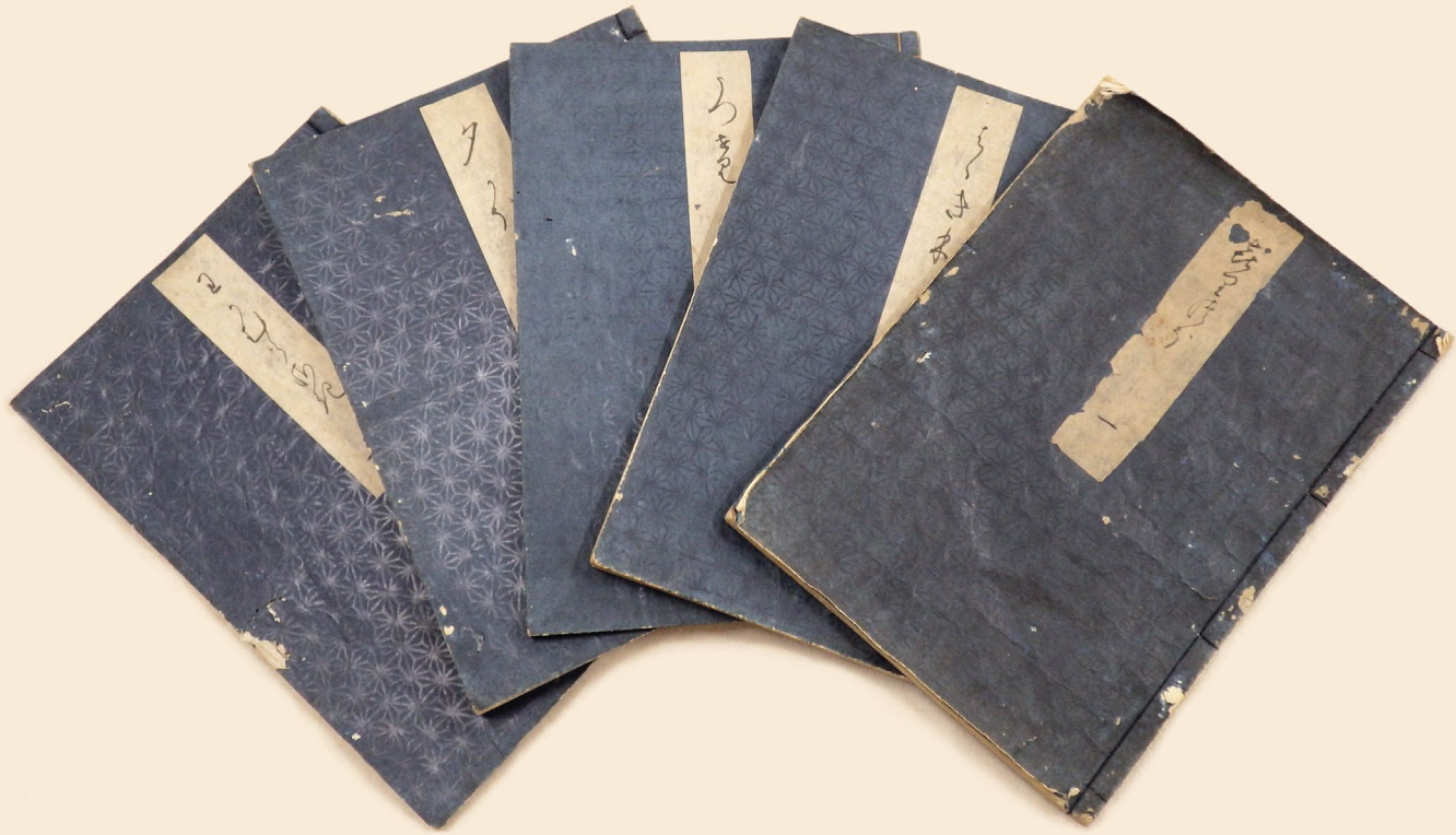
源氏物語(重要文化財菅茶山関係資料)