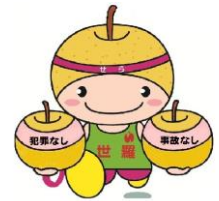
世羅町イメージキャラクター せら坊