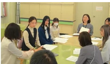
広島文教大学での編集会議の様子

創刊を記念してイベントを開催します。編集部によるトークショーやクイズ大会などを行います。（別紙参照）