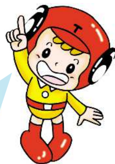
県税イメージキャラクター 「タツ君」