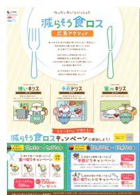
ポスター (A2サイズ予定)

※提供部数は事務局に一任いたします、ご希望の部数のご要望に沿えない場合がありますのでご了承ください。