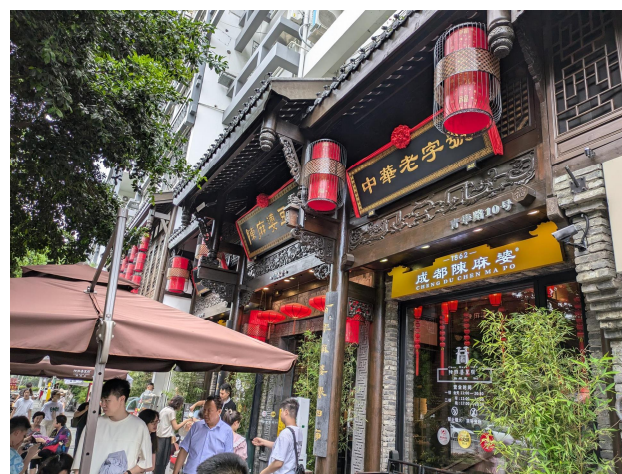
ペアリングイベント会場（陳麻婆豆腐青華店）