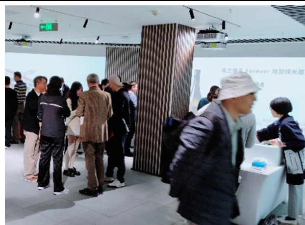
昨年度の商談会の様子