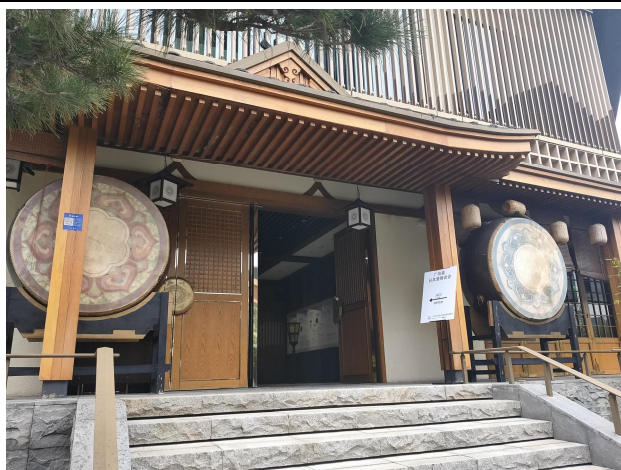
昨年度の商談会場（中日会客厅）