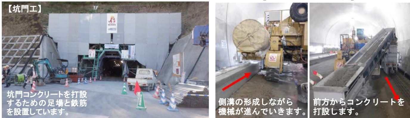
【スリップフォーム工法】

今年の夏も暑い日が続きましたが、トンネル内の気温について、皆さん気になりませんか？『直射日光が無いので涼しい』『気温は年中一定』と思われる方も多いとおもいます。実際のところを調査してみました。