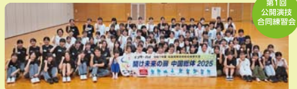
第1回公開演技合同練習会

式典・演技チームは、総会開会式に向けて、高校生が主体となり、演技、音楽、映像、アナウンス、手話通訳、会場装飾の企画や立案、研修など、着々と準備を進めています。