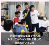
阿品台分校の生徒が来校したレクリエーション活動を通して、交流を行いました。

廿日市特別支援学校 阿品台分校は、分校が設置される以前より、廿日市西高校との交流を行ってきました。今年度は、廿日市西高校の体育祭を見学したり、生徒会交流を行ったりしています。