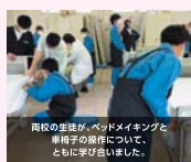
高校の生徒が、ベッドメイキングと車椅子の操作について、ともに学びました。

黒瀬特別支援学校と黒瀬高校は、来年度の分校設置に向けて、文化祭や体育祭などの行事で交流を行ったり、黒瀬高校の福祉科の生徒と一緒に実習を行ったりしました。