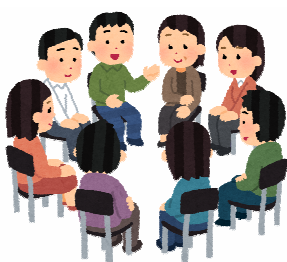
ワークショップの開催