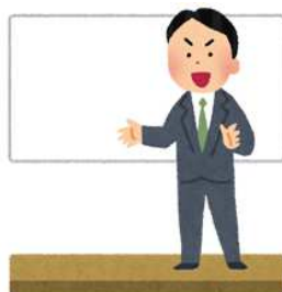
講師の謝金・旅費