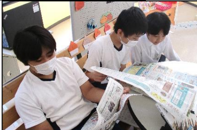
休憩時間に玄関ホールで