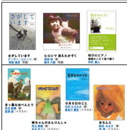
8月6日の全校平和学習で 関連図書をプレゼンテーション