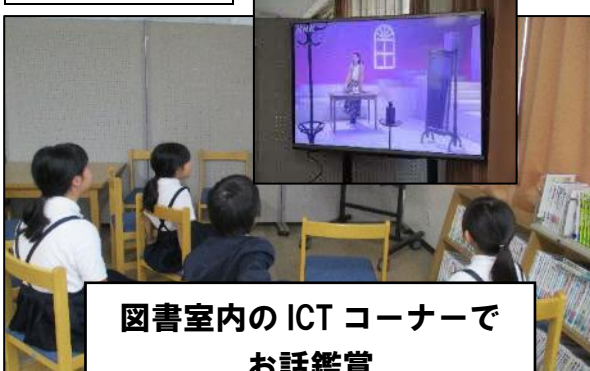
図書室内の ICT コーナーで お話鑑賞