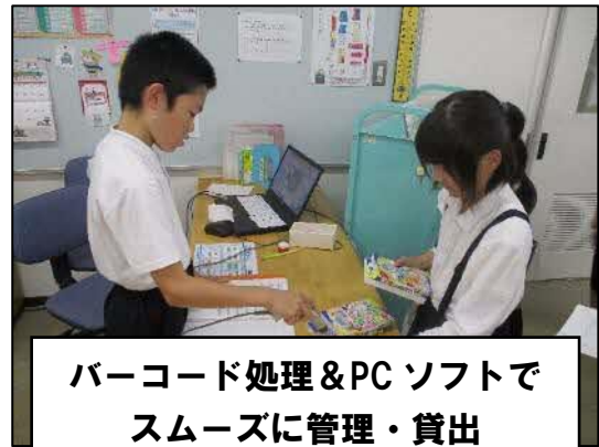
バーコード処理&PCソフトで スムーズに管理・貸出