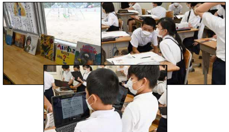
4年国語科「一つの花」 作品世界に深く入り込み、PCを活用して語り合う