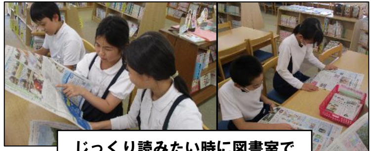
じっくり読みたい時に図書室で